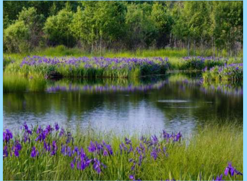
Водные ирисы (касатики)