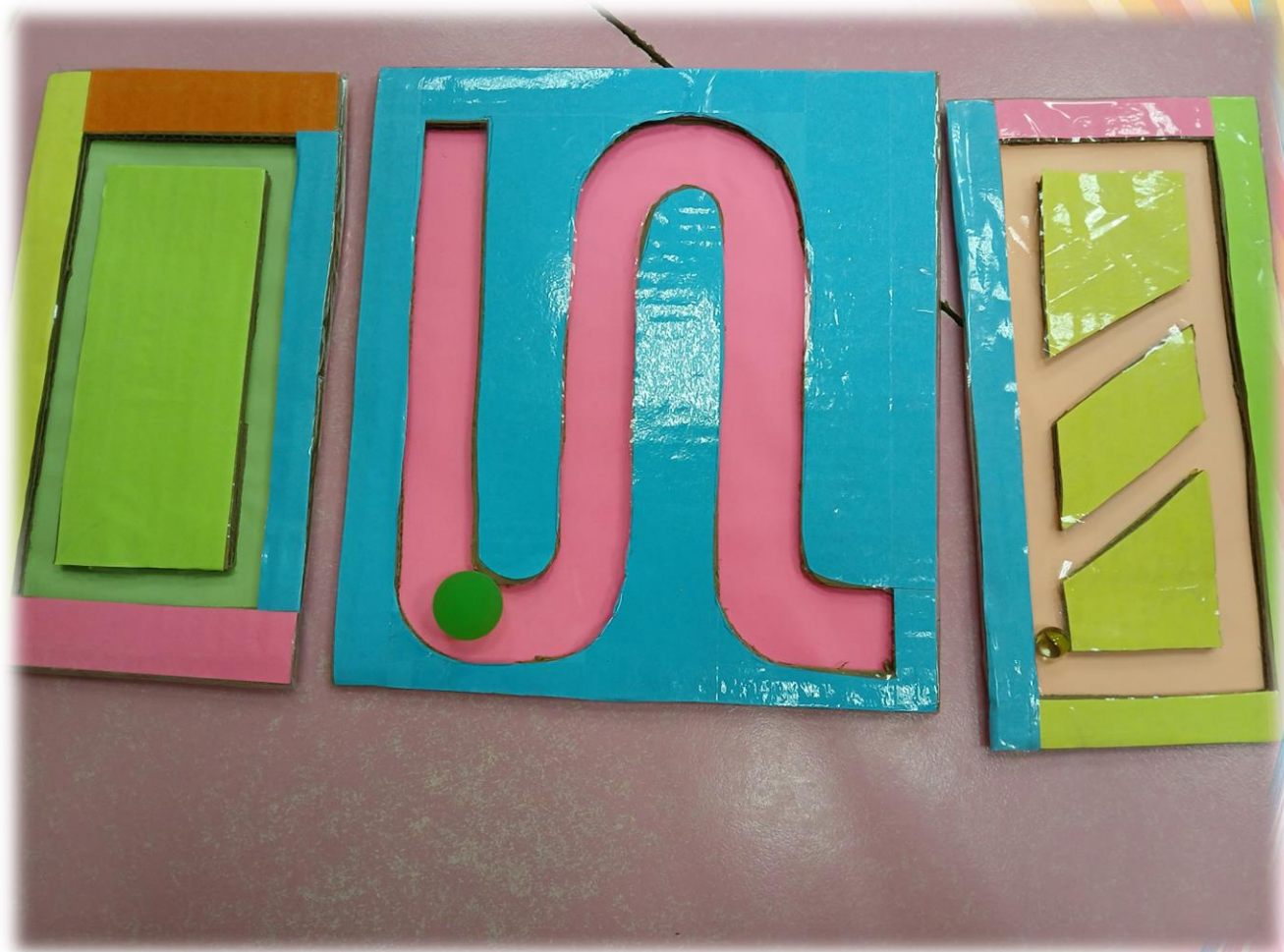
Балансир для рук