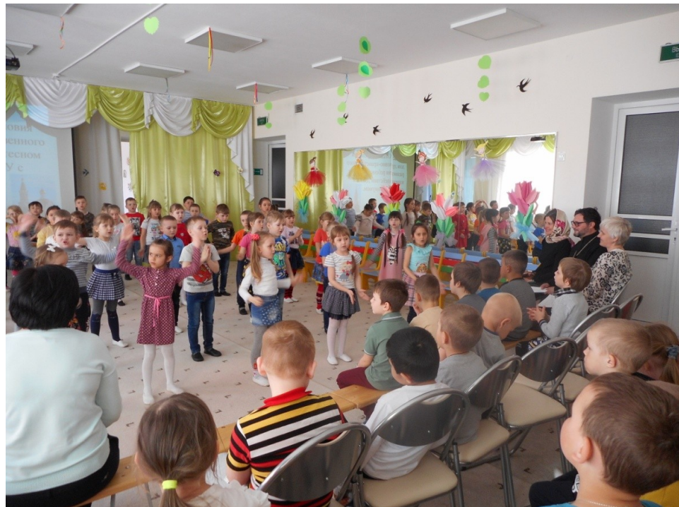
Встреча со служителями храма.