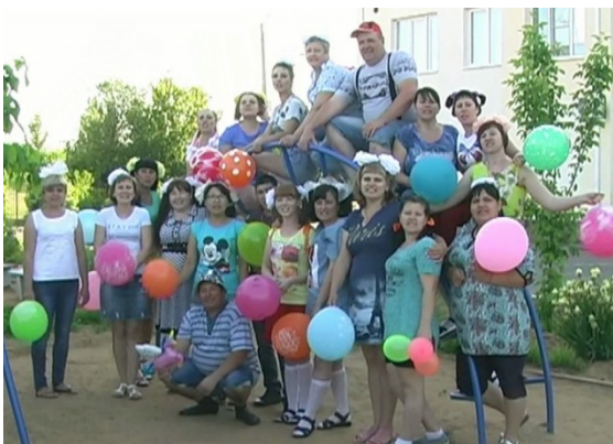
Выпускной гр. «Васильки».