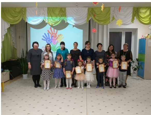
Фестиваль песенного творчества

«Я, ты, он, она – вместе дружная семья!»