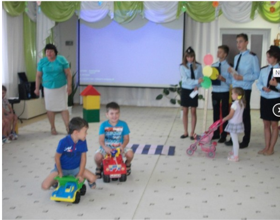
Полицейский класс ПДД.