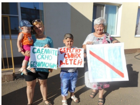
Акция «Открытое окно опасно для ребёнка»

3.3 Вовлечение родителей в воспитательно - образовательный процесс ДООУ (участие в разработке ООП и т.д)