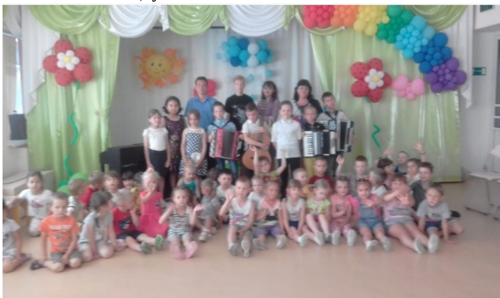
Встреча с воспитанниками музыкальной школы.