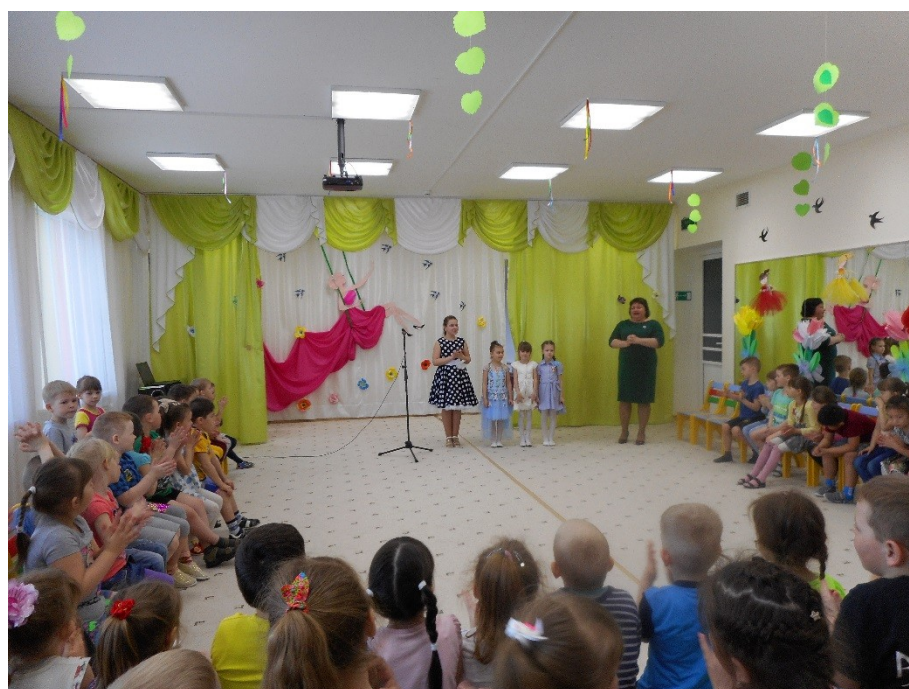
Вокальная студия «Мечта» МЦ «Импульс».