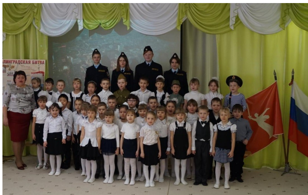
Полицейский класс. 2 февраля Сталинградская битва.