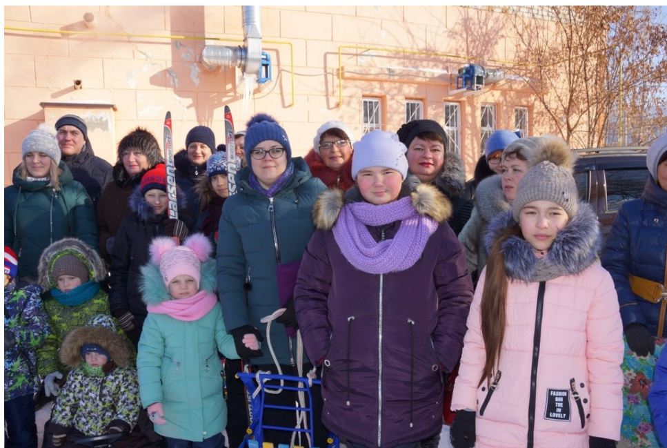
«Лыжня 2019» СМ. новости на сайте.