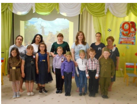
Фестиваль патриотической песни.