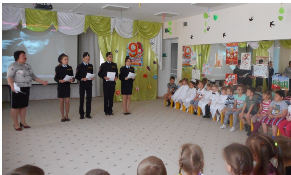
Полицейский класс. 9 мая.