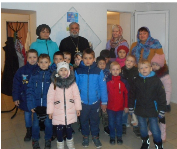
Экскурсия в храм. (см. новости сайт)