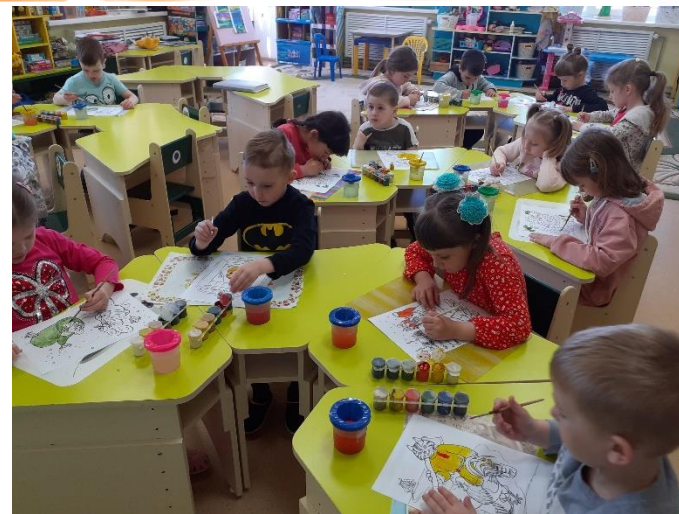
«Рисуем героев сказок»