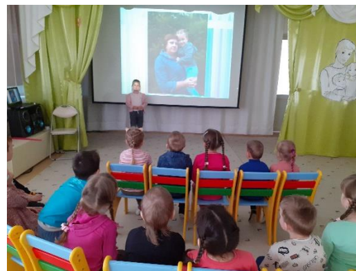
Фото- знакомство «Ладушки- ладушки, дедушки и бабушки»